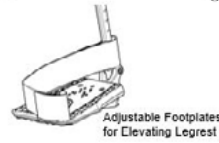
Elevating Legrest and calf Pad