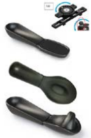
Almofada hemi com sistema de rotação 360°